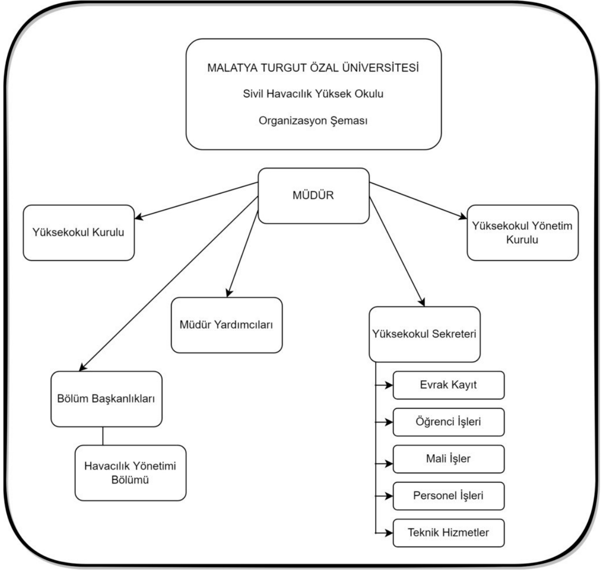
Şekil 1. Organizasyon Şeması